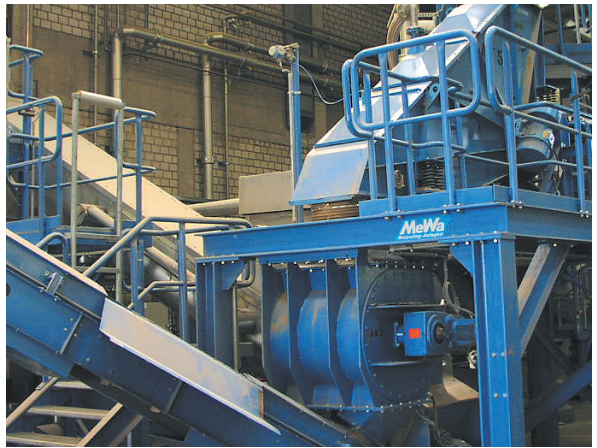
Figure: Le immagini mostrano dei particolari di uno dei più moderni impianti di riciclaggio di frigoriferi in Germania.

Per il monitoraggio di impianti di riciclaggio di frigoriferi abbiamo inoltre nella nostra gamma di prodotti un sistema di misurazione dell'O 2 paramagnetico e un sistema di misurazione del pentano (infrarossi).