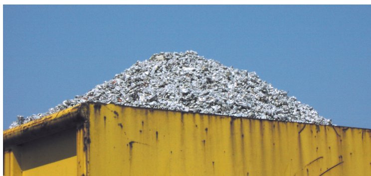
Figura: materie prime preziose, opportunamente recuperate mediante il riciclaggio!

Se si misurano contemporaneamente parecchie componenti, è necessario utilizzare un numero adeguato di combinazioni filtro/detector.